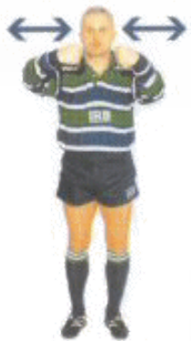
10. Le plaqueur n'a pas lâché le plaqué